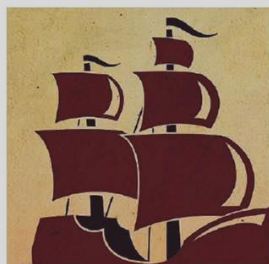
DIALOGHI Il logo della locandina

Nel menù, tavole rotonde sul Mediterraneo e sulle regole della deontologia